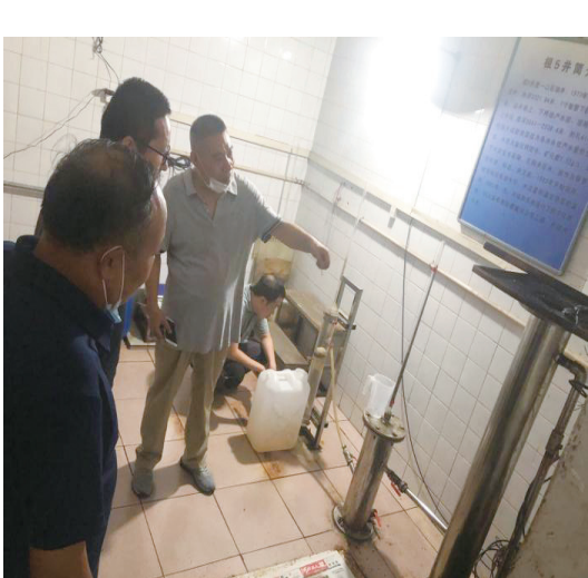
石家庄市应急管理局（地震局）

调研组成员充分肯定了极5井动水位观测的重要性，并从技术层面提出了很好的建议，为石家庄市地震观测站以后的升级改造提供了新的思路。