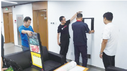
雄安新区震灾预防中心

地震预警信息服务是地震预警建设的“最后一公里”，雄安新区作为全省首个地震预警信息发布项目的先行先试地区，为今后其它市县布设地震预警信息发布的全面实施积累了宝贵的经验。