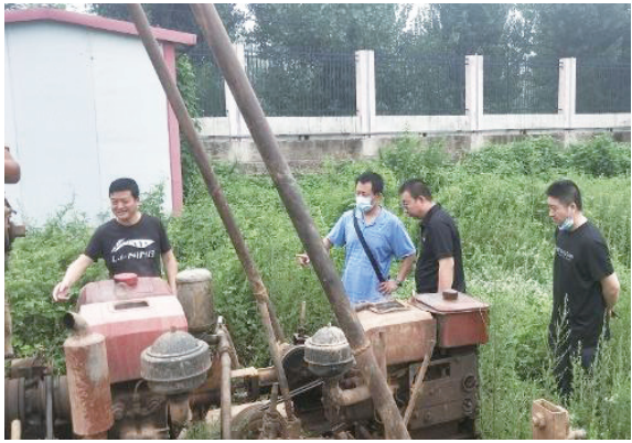
随后调研组来到襄都区应急管理局（地震局）指挥中心会议室，就省、市、区三级防震减灾主管部门区域地震安全性评价监管工作的主要内容、

调研组一行来到区域地震安全性评价工作20号钻孔现场，查看了钻孔深度、岩心取样情况和施工日志。详细询问了施工方技术负责人波速测试、前期钻孔位置的布设、地球物理浅层勘探最大测量深度等情况。