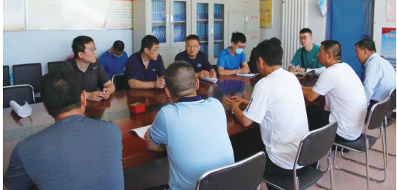
应急救援处震害防御中心

下一步，省地震局将对调研成果进行汇总整理并编写地震灾害损失预评估和应急处置要点报告，为有关方面做好防震减灾和抗震救灾工作提供更好的地震安全服务保障。